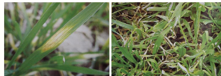
小麦缺钼叶片症状

小麦缺钼首先发生在叶片前部，叶色褪绿，接着在心叶下部的全展叶上，沿叶脉平行出现细小的、黄白色的斑点，并逐渐地连成线状、片状，最后使叶片的前部干枯，严重的整叶干枯。