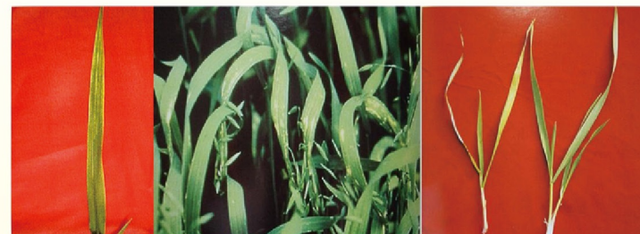
小麦缺锰叶片症状 缺锰叶片典型症状 缺锰植株（左）与正常植株

小麦缺锰病斑发生在叶片中部，病叶干枯后叶片卷曲或折断下垂，叶前部基本完整。缺锰早期叶片出现灰白浸润斑，新叶脉间褪绿黄化，随后变褐坏死，形成与叶脉平行的长短不一的短线状褐色斑点，叶片变薄变阔，柔软萎垂，称“褐线萎黄症”。