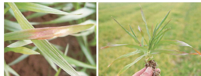
小麦缺磷叶片典型症状

缺磷植株矮瘦，生长迟缓。苗期叶色暗绿，叶尖发焦呈紫红色，叶鞘发紫，下部叶片暗无光泽，不分蘖或少分蘖，穗小，穗上部小花不孕或空粒，千粒重低，抽穗成熟延迟。