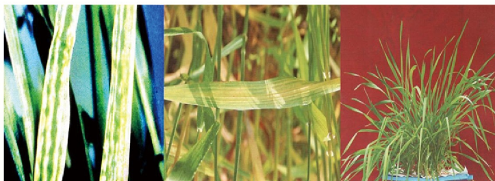
小麦缺镁叶片典型症状 抽穗期严重缺镁叶片症状 小麦缺镁症状

缺镁植株中下部叶脉间失绿，残留绿斑点相连成串呈念珠状。缺镁症状由老叶逐渐发展到新叶，叶片变狭变薄，严重时叶缘卷曲，叶片下坡，有时也发生坏死或枯萎；灌浆受阻，导致减产。