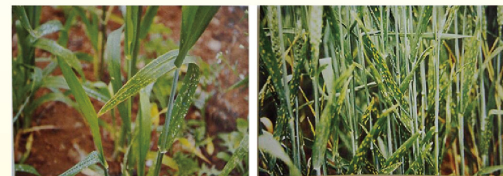
小麦缺氮叶片症状

小麦缺氮生长不良，叶片失绿发黄，叶形变小，叶缘萎蔫，出现生理性叶斑病。根伸长强烈受阻，根细而短，侧根少，尖端凋萎。严重缺氮时导致根和茎部病害，全株萎蔫。