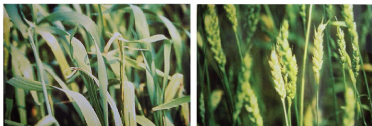
拔节期小麦严重缺铜症状