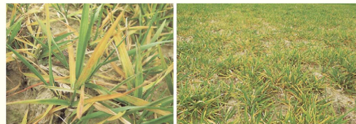
小麦严重缺钾典型症状

缺钾植株呈蓝绿色，茎秆矮小易倒伏，叶软弱下垂，叶片叶尖及边缘枯黄，叶片无斑点，症状首先出现在老叶，老叶衰弱色暗绿，而后逐渐变褐，叶脉仍呈绿色，火烧状。严重缺钾时整叶干枯。分蘖不规则，成穗少，籽粒不饱满。