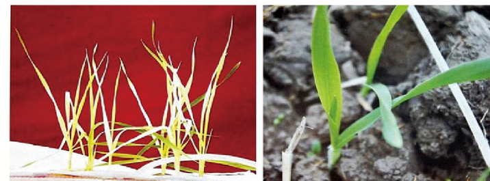
小麦缺铁症状 苗期小麦缺铁症状

小麦长期缺铁，新叶黄化，老叶仍保持绿色，叶脉间失绿，叶脉保持绿色，呈条纹花叶，越近心叶越重。严重时心叶不出，植株生长不良，矮缩，生育延迟，有的甚至不能抽穗。